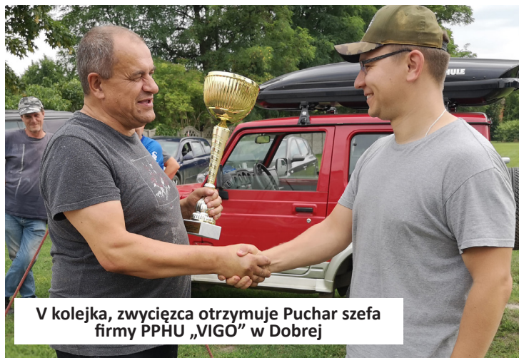
V kolejka, zwycięzca otrzymuje Puchar szefa firmy PPHU „VIGO” w Dobrej