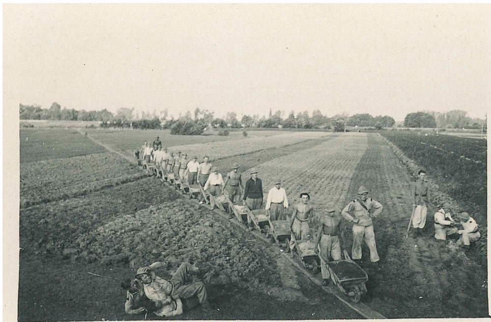
Budowa wałów przeciwpowodziowych przez junaków z hufców pracy (1938)

pełniono na podstawie zaciągu ochotniczego. Hufce również zapewniały przysposobienie do służby wojskowej np. absolwentom gimnazjów (junacy z cenzusem). W naszym regionie junacy byli skoszarowani w miejscowości Góry, gm. Orzeszków (obecnie gm. Uniejów) oraz w Księżej Wólce, gm. Pęczniew (obydwie miejscowości w ówczesnym powiecie turecki). Organizacyjnie podlegali pod II baon JHP, chociaż tablica pamiątkowa umieszczona w tamtym czasie na wale powodziowym wspominała też III baon JHP. O pobycie w szeregach junackich w ramach przysposobienia do służby wojskowej pisał polityk, dyplomata, wykładowca Władysław Bartoszewski. Służbę latem 1939 roku Bartoszewski odbywał w miejscowości Góry, budując wraz z innym junakami odcinek wału wzdłuż rzeki Warta. W czasie okupacji i po II woj-