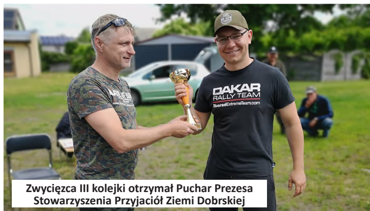
Zwycięzca III kolejki otrzymał Puchar Prezesa Stowarzyszenia Przyjaciół Ziemi Dobrskiej