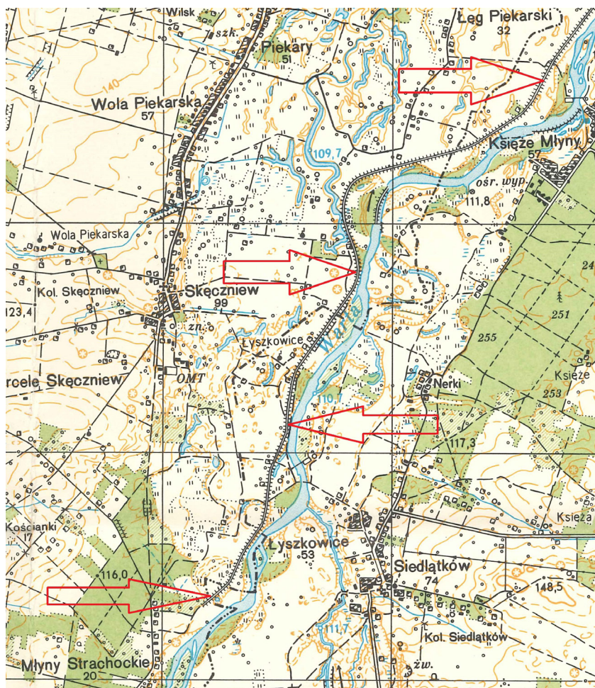
Wał przeciwpowodziowy na mapie topograficznej. Stan przed budową Zbiornika Jeziorsko

stracją Zbiornika Jeziorsko była zmuszona dokonywać odpowiednio dużych zrzutów wody do koryta rzeki. Niestety oprócz międzywala, zostało wówczas zalanych jeszcze około 100 ha gruntów rolnych i oraz podtopione 2 gospodarstwa rolne (na prawym brzegu Warty). Bezpośrednią przyczyną powodzi był oczywiście zrzucany nadmiar wody na jazie zapory czołowej, a pośrednio przepust ze źle funkcjonującą klapą