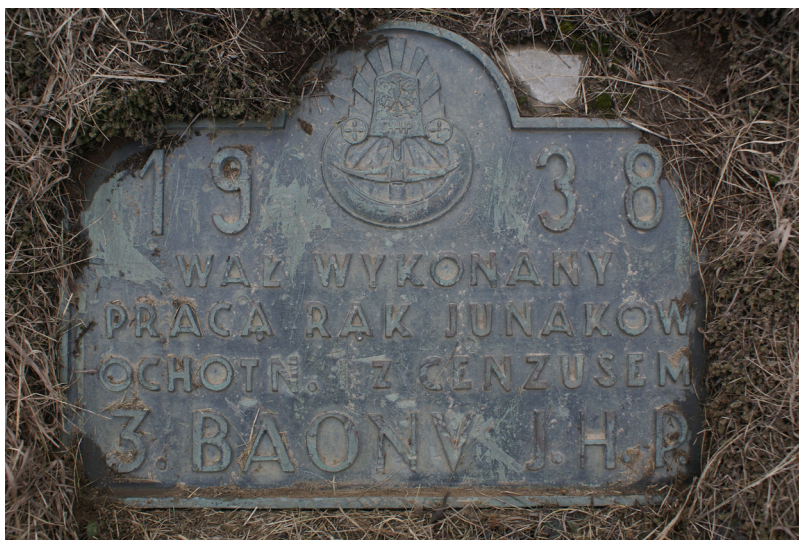
Tablica pamiątkowa Junackich Hufców Pracy z 1938 r.

Jest to ziemny wał przeciwpowodziowy. Rzeka Warta w przeszłości była rzeką niosącą w pewnych porach roku duże zagrożenie dla ludności i jej dobytku. Dotyczyło to również naszej okolicy. W okresie zimowo-wiosennym i letnim dość często zdarzały się powodzie, których przyczynami były wody roztopowe, zatory lodowe i intensywne opady deszczu. Chcąc uchronić tereny naszych nadwarciańskich miejscowości w latach trzydziestych ubiegłego wieku zainicjowano budowę wałów przeciwpowodziowych. Na naszym terenie budowę wału zapoczątkowano na lewym brzegu Warty w Młynach Strachockich, by dalej ją kontynuować na terenie Skęczniewa, Łyszkowic, Woli Piekarskiej i Łęgu Piekarskiego. Odcinek ten został wybudowany w 1938 roku i miał niespełna 6 km długości. Oczywiście kontynuacja jego miała miejsce i biegała w kierunku Uniejowa i dalej